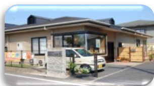
ふれあい多居夢 希