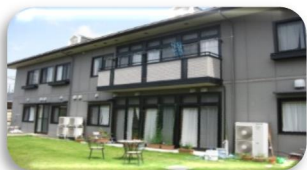
ふれあい多居夢 川越

個人情報の保護について 個人情報の保護に関する法律のほか関係法令等に基づいて、適切に取り扱います。